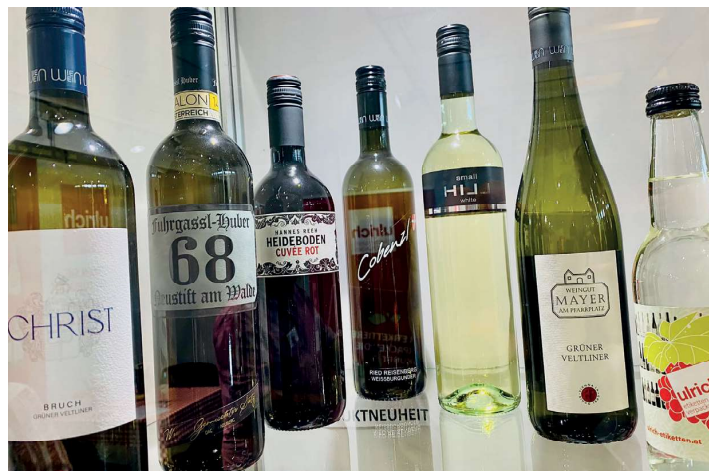
Natürlich wurden auch viele unterschiedliche Etiketten präsentiert

Das Basismodell eignet sich für das Auftragen von Einzeletiketten. Der Leistungsumfang des Basismodells wurde bei dem nächsten Modell erweitert, so dass dieser ein oder zwei verschiedene Etiketten auf die Produktverpackung anbringen kann, wie dies z.B. bei Weinflaschen üblich ist. Die eingebaute LED-Anzeige gibt die Anzahl der bereits etikettierten Produkte an und der integrierter Speicher für bis zu neun verschiedene Etiketteneinstellungen für Vorder- und Rückseitenaufträge erleichtert die Bearbeitung wiederkehrender Produktionsaufträge.