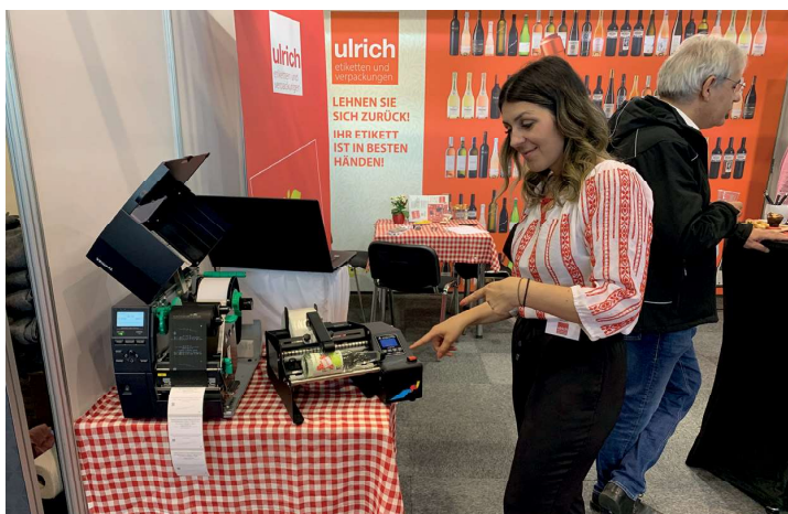
Am eigenen Label-Applikator wurden Flaschen mit, für die Messe gestalteten, Etiketten versehen.