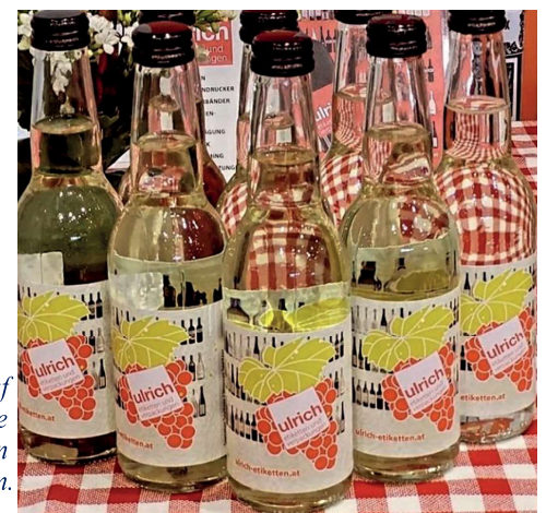
Die auf der Messe etikettierten Flkaschen.